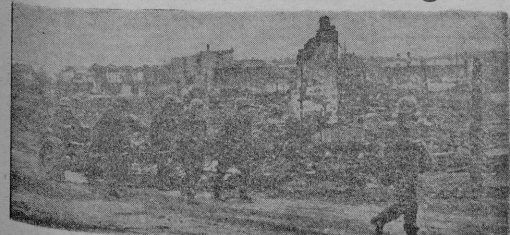
La foto nos muestra a un grupo de infantes alemanes en su lucha entre las ruinas de Stalingrado, cambiando de posición a un cañón ligero, para tomar bajo su fuego a posiciones enemigas

Disposiciones del Diario Oficial de la Marina