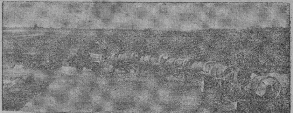
Tiradas por un tractor son transportadas en carritos estas bombas pesadas con destino a un aeródromo alemán en donde pasarán inmediatamente a los bombarderos de un grupo estacionado en el frente oriental

El Jefe de las fuerzas norteamericanas en Europa, a Washington