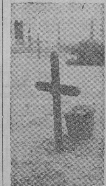
En la fosa común. Una cruz sin inscripción alguna. Una maceta sin flores. ¡Soledad... cuido!

Semanas antes del día de Difuntos, es cosa frecuente ver los domingos a numerosas personas que limpian las sepulturas, pintan los herrajes, siembran, escardan, hermean en una palabra el lugar donde reposan sus familiares al objeto que el día de la conmemoración de los difuntos presente un aspecto agradable todo el recinto del cementerio, dándose el caso de que son los más humildes los que más interés demuestran por tales tareas, y muchos, sacrificándose, quizás privándose de algo muy necesario adornan la sepultura y encienden los cirios, que pueden y pasan todo el día junto a sus muertos. Y por contraste, en algunos suntuosos mausoleos, no hay nadie de la