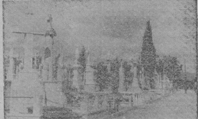
Aspecto parcial de la parte moderna del cementerio de Palma. Por lo general impera el buen gusto y el arte en la mayoría de las sepulturas

Durante todo el día, una multitud constantemente renovada, visita el cementerio, algunos por pura curiosidad, otros como quien cumple un deber de cortesía, de prisa y corriendo, se inclinan ante la sepultura familiar, musitan una corta oración, y salen del sagrado recinto, como quien huye de un lugar infectado. Al atardecer los visitantes van disminuyendo, lentamente se retiran los que allí han pasado el día, el silencio invade el campo Santo, y una vez anochecido, no queda nadie, nadie más que los cuerpos de los que allí reposan haciendo recordar la contemplación del cementerio sumido en la quietud y silencio aquella que dijo el poeta: