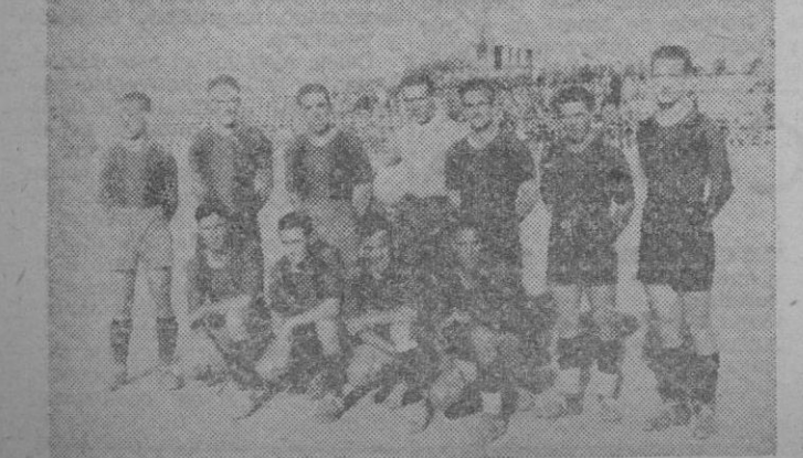
El once del Poblense, que el domingo completamente remozado hizo su presentación en Buenos Aires.