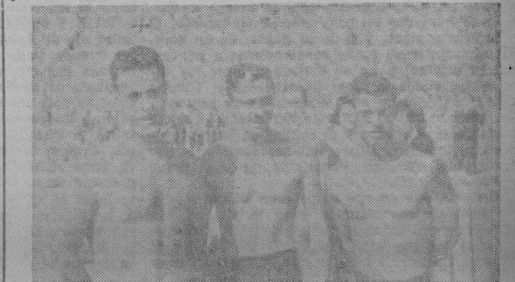
Junto con Sabaté, posan para BALEARES los vencedores en la VII Travesía del Puerto.

Después de dada la clasificación por el Jurado, que estaba compuesto por los colegiados señores Kellner, Roig, Tomás, Bronzo, Picó, Mut, Rusell y Gutiérrez, el Presidente del Real Club de Regatas Sr. Valls procedió a la entrega de premios por este orden: