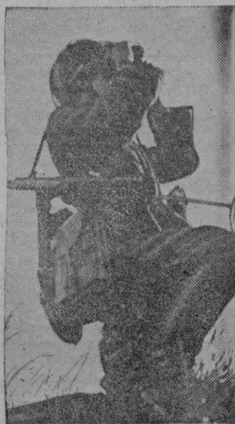
Este suboficial alemán escudriña la línea enemiga en el sector de Rjev. Inmediatamente después las fuerzas a sus órdenes inician el asalto en contrataque sobre ridos de resistencia soviéticos.