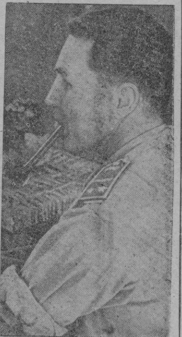
El Duque de Aosta, símbolo de los Jefes caídos en el campo del honor

La mañana del 26 de junio, ya con pleno desarrollo triunfante el avance italoalemán en territorio egipcio, mientras se desencadenaba una tremenda batalla entre Sidi-el-Barrani, recién conquistado, y Marsa Matruk, en trance de ser cercado y tomado, cayeron en su puesto de combate el general de división comandante del 20 Cuerpo de ejército italiano y