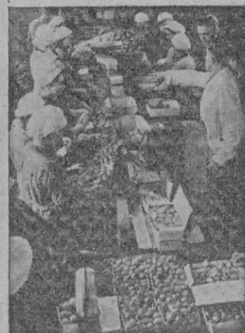
La preparación de fruta para ser congelada

La revolución, tan dominante en todo— fausta renovación de la vida europea—afecta a detalles que aun pareciéndonos nimios, son en realidad parte muy importante de la vida, muy especialmente aquellos que afectan a las materias alimenticias.