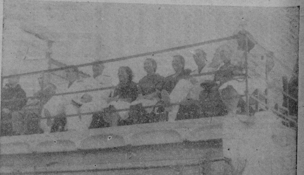
Nuestras primeras Autoridades, Jerarquías y personalidades invitadas, en la presidencia de los actos celebrados por motivo de la Clausura del III Albergue Nacional Femenino del S.F.U.