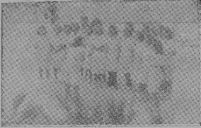
En la clausura del Albergue del S. E. U. actuaron brillantemente las camaradas del grupo de música y coros del mismo.