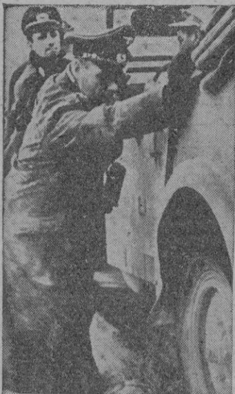
Rommel ayudando a sus soldados

Berlin. — En la región de El Alamein en el frente egipcio, «Stukas» y escuadrillas de caza alemanas atacaron ayer las posiciones y columnas de vehículos británicos.