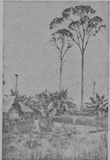
Paisaje filipino

mer lugar, a sus lejanos preparadores del 98.—Ahora bien; cuando el sadismo de una generación elige nombre y bandera en la fecha de una derrota, no puede contentarse con el simple retés de emancipación colonial, que todas las potencias europeas, comenzando por Inglaterra; han te-