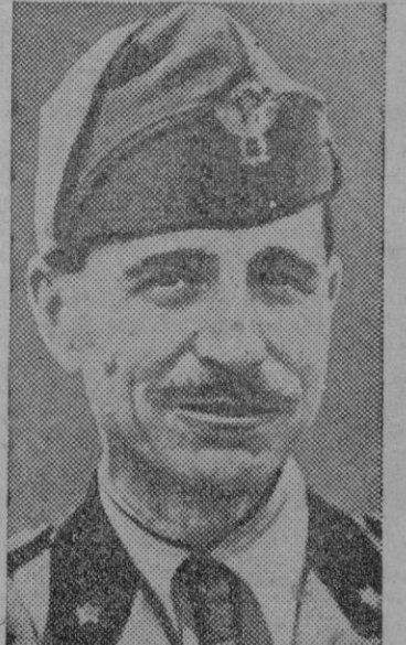
El General Bastico, Jefe de las Fuerzas armadas en Africa, recientemente ascendido a Mariscal de Italia