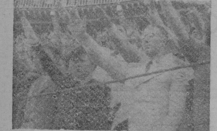
Nuestro jefe Provincial, que presenció la corrida con su esposa desde una barrera, en el momento en que fué interpretado el himno nacional

paganda que se hizo era verdad. Se trataba de un cartel magnífico, ganado de postín y matadores de los que cuentan sus actuaciones por éxitos.