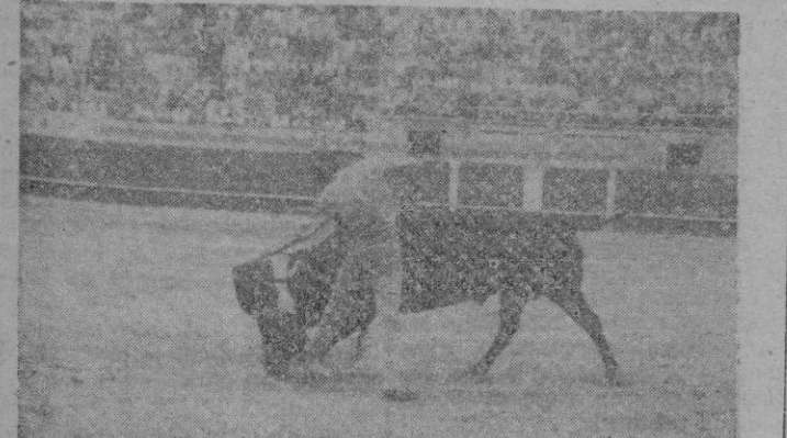
Gallito tuvo algunos destellos de gracia torera. Le vimos un natural no perfecto pero bastante regular

al beber cerveza o cualquier otro aperitivo pídalas en el bar o restaurante donde Vd. comiera. ¡Qué cosa más exquisita...! Pedidos al Teléf. 11-63