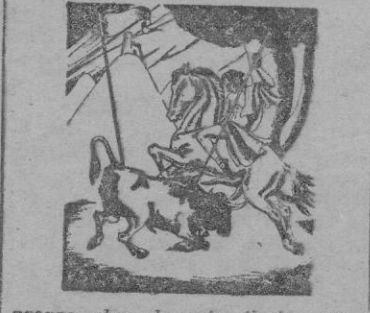
rasgos algo de esta fiesta, porque para describirla, sería preciso escribir numerosos artículos.