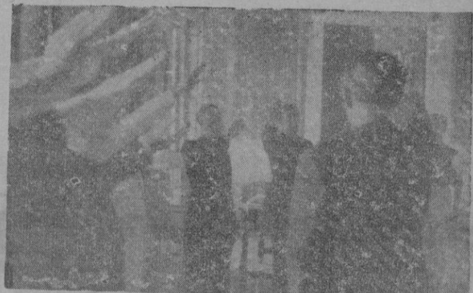
El Consejo Provincial de la Falange balear entonando el «Cara al Sol» en el acto de la posesión