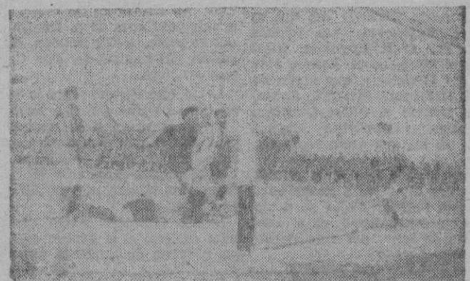
El portero del San Martín en tierra, la pelota por los aires, la meta descubierta... Parece será un gol ¿verdad? Pues no lo fué. Este que está casi en cuclillas, si esperan Uds. un rato, verán como logra despejar la situación con la cabeza.

Si alguien se entretuvo en contemplar el aspecto maravilloso que presentaba el campo de Buenos Aires a la hora de dar comienzo el encuentro entre el C. D. Mallorca y el San Martín, debió pensar sin duda que iba a disputarse nada menos que la fi-