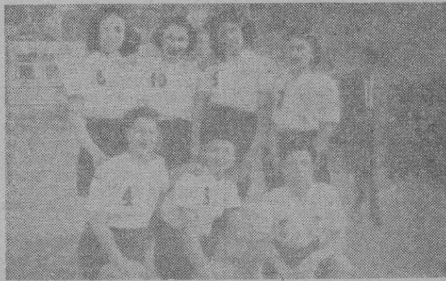
Equipo femenino del R. C. de Regatas vencedor del Sóller y uno de los mejores conjuntos femeninos de la isla