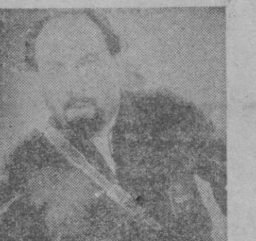
Otra escena sencillamente emocionante del gran film «Raza»

El S.E.U., en hermandad filangista, pone la cultura a tu alcance por mediación de la Academia «Juan Barba», para obreros y ex-combatientes.