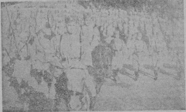
Desfile de la Victoria en la gran película «Raza»

UNOS DATOS CURIOSOS Creemos de interés dar algunos datos interesantes sobre el rodaje: personajes, gaste, etc., de la película. Se ha fantaseado un poco sobre el coste de la misma. Sin embargo el precio aproximado, su coste total no ha pasado de 1.650.000 pesetas. Los metros de negativo