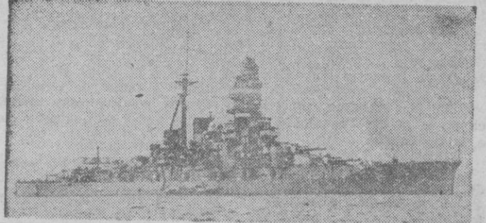
Berlin. — «¿Son necesarias las unidades de línea?» Esta pregunta, que ocupa el primer plano de

Estudio de la estrategia naval, por el almirante alemán Pfeiffer