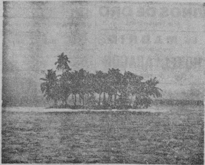
Uno de los miles de islotes de coral que pueblan la inmensidad del Pacífico