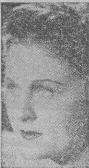
Marika Rokk que es Marika Rokk, toda guapeza, pertenece al grupo de las primeras y contiene algunas variantes que la animan. Por ejemplo el asunto de espionaje en que desemboca la vida de la hermana frívola.

«Kora Terry», la historia de dos hermanas físicamente gemelas y completamente distintas de modo de ser, es asunto harto explotado por el cine. Y precisamente el cine alemán, sobre esta línea argumental, nos ha ofrecido ya algunas buenas cintas. Unas humorísticas, otras dramáticas.