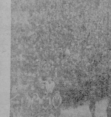
La multitud estacionada ayer ante la Cruz de los Caídos