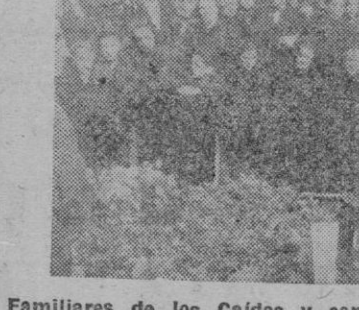
Familiares de los Caídos y camaradas de la Sección Femenina rezan ante la Cruz

Una vez celebrada la misa todos se trasladaron a la Cruz de los Caídos donde el Capellán del Frente de Juventudes dió lectura a la Oración de Sánchez Mazas. Acto seguido el Jefe local dió lectura a los nombres de los felanitxenses que cayeron en la Cruzada, cantán dose por último el «Cara al Sol».