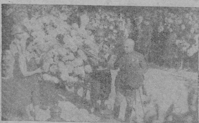
El Excmo. Sr. Capitán General de Baleares deposita ante la Cruz, la corona ofrendada por el Ejército

Otro «Día de los Caídos». Ellos, que nos legaron una inolvidable lección de renacimiento, corroboraron con su sacrificio el tono y amplitud de la Cruzada. Pocas palabras. Que el silencio es también reverencia y respeto. Y respeto, reverencia y gratitud eterna merecen nuestros Caídos por Dios y por España.