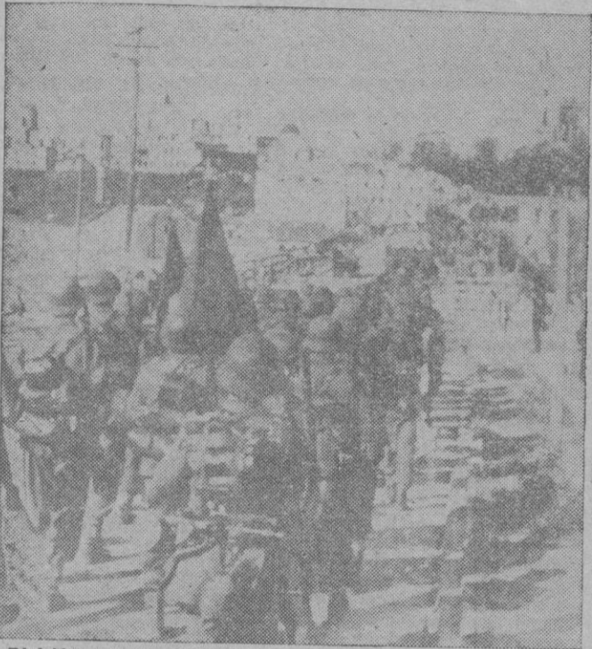
La División Azul se dirige hacia el frente de combate para tomar parte en la cruzada anticomunista