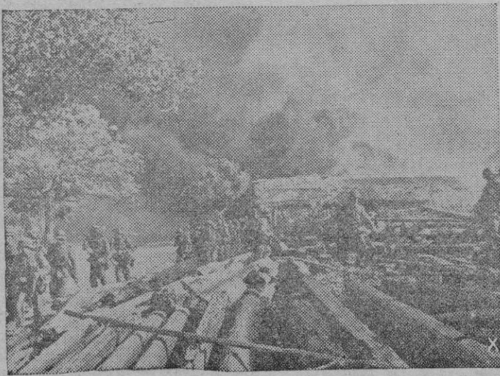
Una compañía de tiradores alemanes acaba con la última resistencia de las tropas rojas, en una ciudad ocupada (SERVICIO EXCLUSIVO)