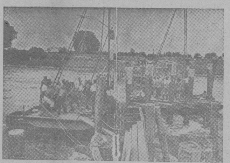
Los zapadores del Reich reconstruyen rápidamente un puente volado por los rusos en su retirada

Continúa metódicamente la persecución de las tropas soviéticas en retirada. Nuestras tropas han ocupado Stanislaus y Kolome y avanzan por el Nieper. TANQUES INTACTOS Berlin. — En el frente septentrional, después de encarnizados combates ha sido capturado un tren soviético en el que se encontraban numerosos carros de combate intactos. La producción de los Astilleros de la Unión Naval de Levante UN PLAN DE TRABAJO DE 16 MILLONES DE PESETAS Valencia. — La Unión Naval de Levante desarrollará un plan de trabajos con un presupuesto superior a diez millones de pesetas lo que supone trabajo seguro para tres años. Se terminará la construcción del vapor «Campeón», de 12.000 toneladas, para la Campsa; cuatro buques para la navegación de cabotaje; dos remolcadores para el puerto de Sevilla y dos buques de 8.000 toneladas que serán destinados a la línea de Canarias. El Gobierno paraguayo LOGRA ahogar un movimiento de rebeldía Buenos Aires. — Comunican de Asunción, que el Gobierno paraguayo ha logrado ahogar un movimiento de rebeldía organizado por los oficiales de la guarnición de Pilar. Roma. — El comunicado dice que la guarnición de Debra Tabor se ha visto obligada a capitular por falta de víveres. A los defensores de la plaza les han rendido honores militares.