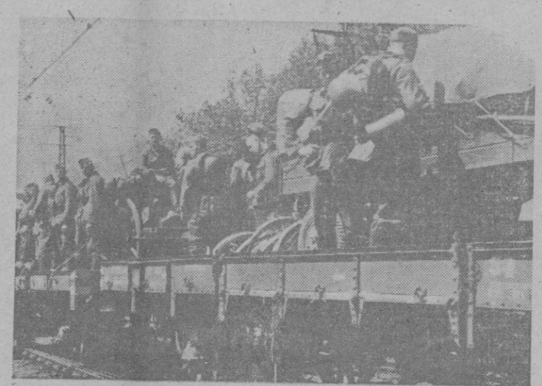
Actividades tras de trenes transportan a los soldados alemanes a los frentes de guerra de Rusia Oriental y Occidental

Los húngaros persiguen a los rusos en retirada En Smolensk fueron destruidos varios trenes UNA CRONIQUELLA Berlin. — Oficialmente se comunica que en los Estados Bálticos un ejército soviético ha sido completamente aniquilado. Varias divisiones mixtas y varias brigadas de infantería y carros blindados han quedado destruidas completamente. Otras divisiones han perdido la mayor parte de sus efectivos. En la región de Minsk se precisan cada vez con mayor claridad los síntomas de descomposición del ejército rojo, según hacen ver los propios prisioneros capturados a los soviets. Asociados por los comisarios, los soldados intentan desesperadas salidas del anillo de fuego del ejército alemán. Los intentos de salida de las tropas bolcheviques cercadas en Galitzia ha servido para que las fuerzas destruyeran más de 100 tanques de los más grandes que posee el ejército rojo. Una sola división alemana combatiendo con la retaguardia de las tropas soviéticas en retirada ha capturado 7.500 prisioneros.