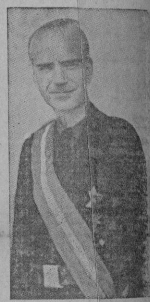
brados en sus campos en defensa de la cristianidad. Ante el largo camino a recorrer para afirmar el rol y fuera la personalidad poderosa de España, la Falange llama a cuantos sientan verdad su dolor y su pasión y se anuncian que tiene para ellos puesto de hermandad y seicto a la vez que delimita herméticamente su contornofrente a quienes en sitios altos o bajos maquinan por cursilía y por traición cobarde, y especulan miserablemente con la tragedia de España.

En esa operación de limpieza ha comenzado ya en forma positiva. Es singularmente interesante señalar que se halla ya en marcha la incorporación de la juventud excombatiente a la masa abnegada de los ex cautivos.