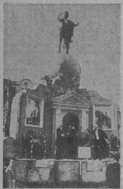
ra de concurso), obra del artista se-La falla de la Plaza del Caudillo (fueor Hurtado.

VALENCIA, 20. (Crónica telefónica de nuestro colaborador SILVA ARAMBURU). — La Primavera entra cada año, en España, por la dorada y luminosa Valencia; se encarama en el alto de una "falla" y cuando, en la noche de San José, las llamas ascendentes hasta ella para devorarla, agita sus alas de mariposa y se escapa hacia las demás regiones de la Península, para atraerlas y deslumbrarlas con su renovado encanto.