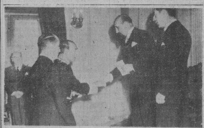
El embajador de España en Bolivia, don Francisco de Amat, saludó al presidente de la República en el momento de la ceremonia de la presentación de Credenciales en la Paz, en presencia del ministro de Relaciones Exteriores y del Director del Protocolo.

PRESENTACION DE CREDENCIALES DEL EMBAJADOR DE ESPAÑA EN LA PAZ