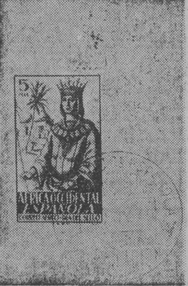
Fotocopia de un sobre franqueado con el sello conmemorativo del "Día del Sello" en Villa Cisneros, Colonia de Río de Oro, Africa Occidental española. La presente fotocopia fue recibida ayer en Madrid.