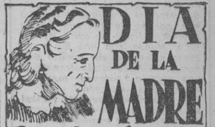
Por JOSE LUIS FERNANDEZ-ROA

EL ARMA DE INFANTERIA HA HONRADO A SU PATRONA Y LA SECCION FEMENINA Y EL FRENTE DE JUVENTUDES HAN CELEBRADO EL "DIA DE LA MADRE"