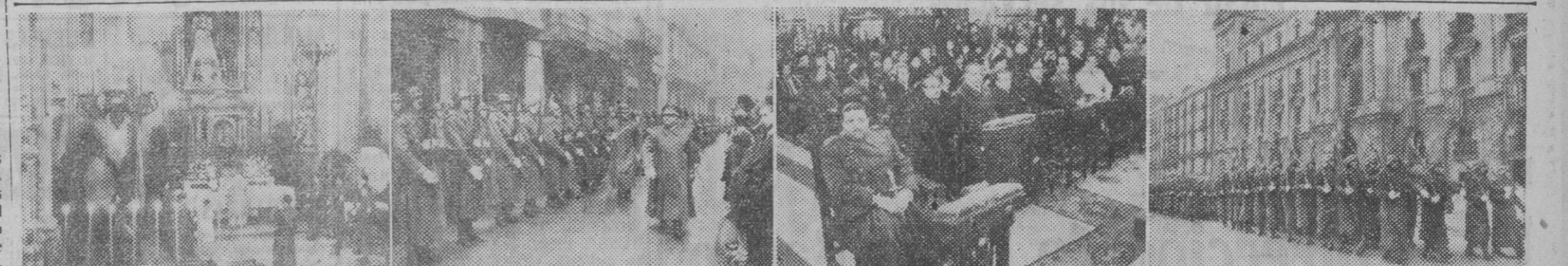
Con la solemnidad de costumbre se ha celebrado esta mañana la festividad de la Patrona de la Infantería española, con una Misa solemne en la Basílica de la Merced. Nuestra información gráfica presenta un aspecto del altar mayor durante la ceremonia religiosa, el capitán general de la Región revisando las fuerzas que han rendido honores, las autoridades que asistieron a los divinos oficios y el desfile de las fuerzas ante el Pabellón de Capitanía.