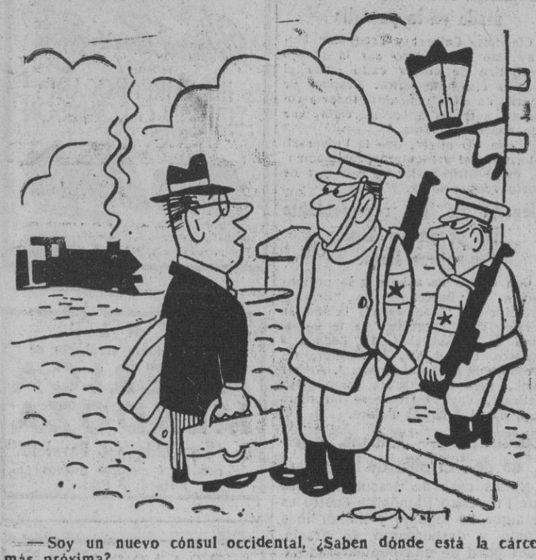
—Soy un nuevo cónsul occidental. ¿Saben dónde está la cárcel más próxima?

"Si Roma es una promesa, España y su Gobierno católico son una realidad"