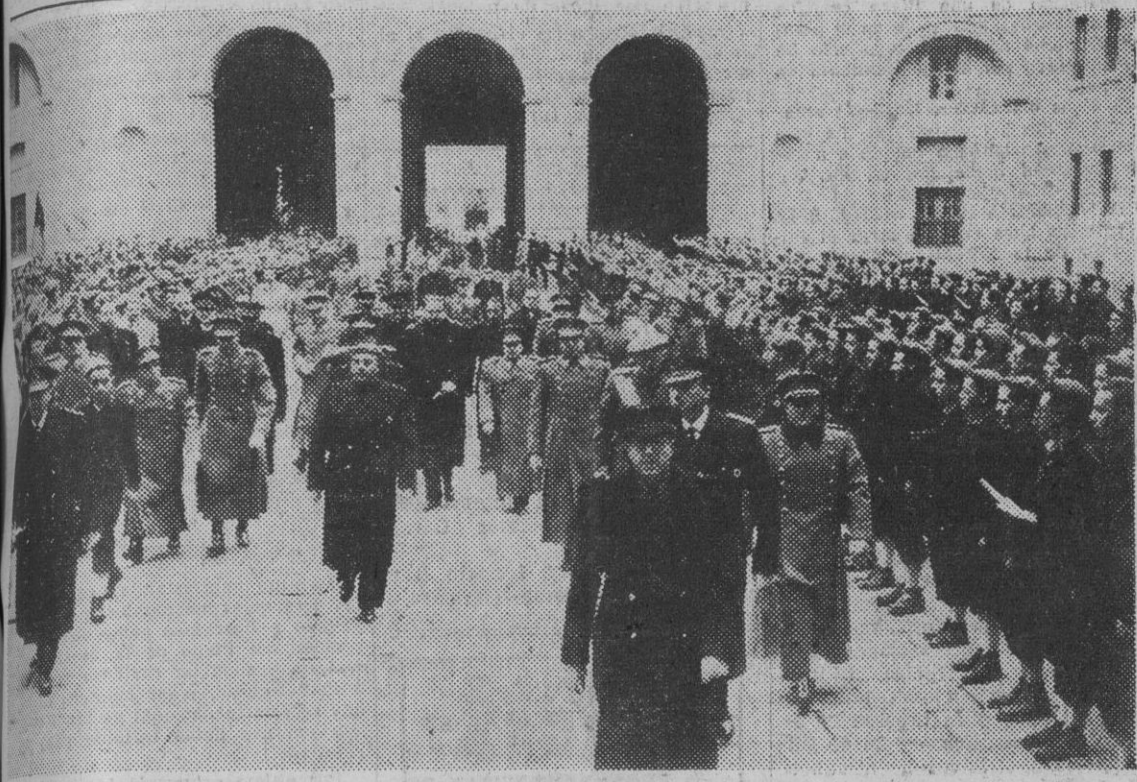
S. E. el Jefe del Estado, hace su entrada en el Monasterio del Escorial, para asistir a los solemnes funerales por el eterno descanso de José Antonio, celebrados con motivo de cumplirse el aniversario de su muerte.