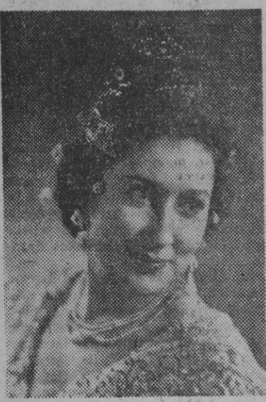
FIGURA DEL TEATRO