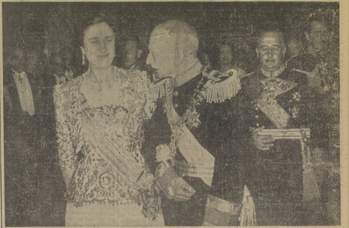
El presidente de la República portuguesa, mariscal Carmona, entrando en los salones del palacio de Ajuda, dando el brazo a doña Carmen Polo de Franco. En segundo término, el Jefe del Estado español lo hace con la esposa del mariscal, al comenzar la recepción celebrada en honor de S. E. el Generalísimo Franco y de su esposa.