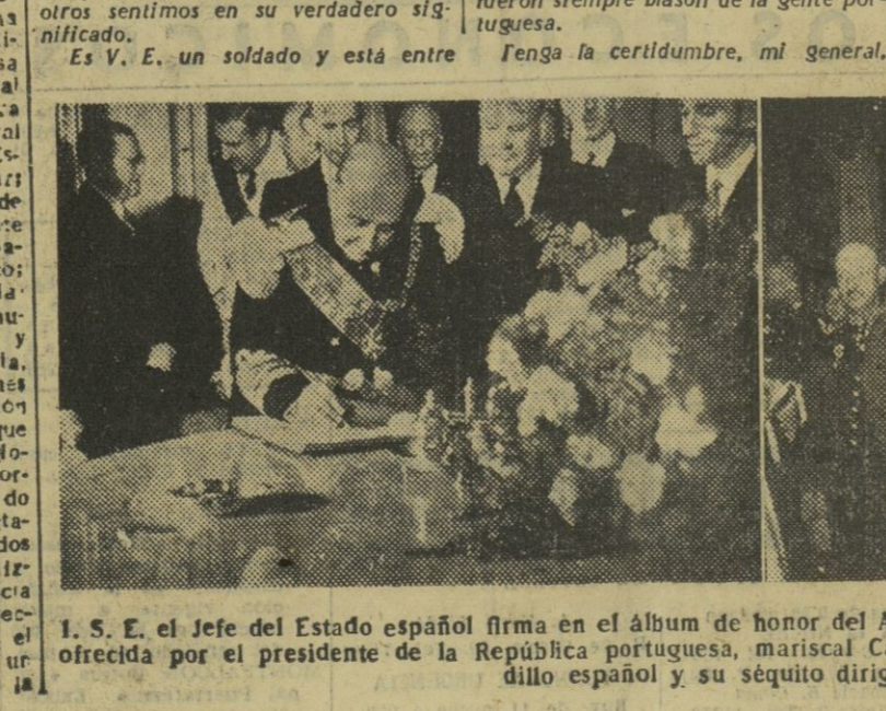
S. E. el Jefe del Estado español firma en el álbum de honor del Ayuntamiento de Lisboa, durante su visita a la Corporación Municipal. — 2. Un aspecto de la recepción ofrecida por el presidente de la República portuguesa, mariscal Carmona, en honor de S. E. el Jefe del Estado español y de su esposa en el palacio de Ajuda. — 3. El Caudillo español y su séquito dirigiéndose a visitar el famoso Monasterio de Mafra.

Porque comulgamos en los mismos sentimientos espirituales, tenemos el mismo amor a la gloria y la misma fe viva en la concepción cristiana de la vida, nos alegra saber que podemos contar con su amistad en cualquier coyuntura. La gratitud y la lealtad fueron siempre blason de la gente portuguesa. Fenga la certidumbre, mi general.