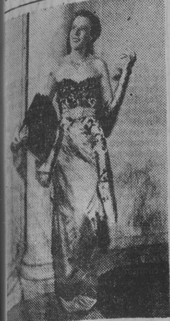
Elegante vestido de noche para otoño, que Robert Piguet presenta en París. Es de satén azul, con el cuello con incrustaciones en azabache.