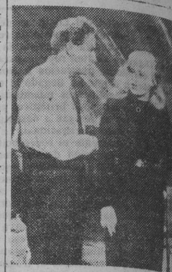
Mirtha Legrand y Arturo de Cordova, en "Pasaporte a Rio", película que se exhibe en el Cristina