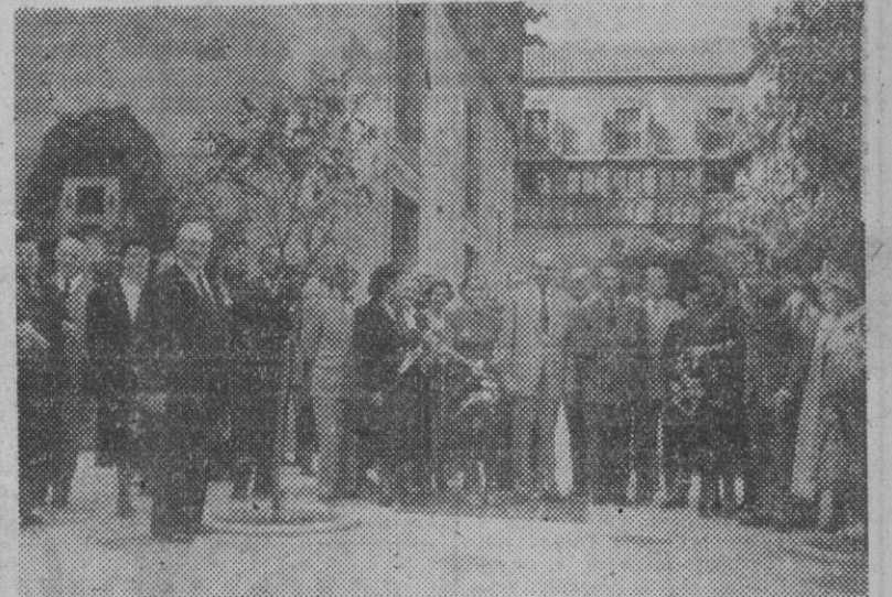
Han llegado a nuestra ciudad numerosos directivos de las distintas Ferias Internacionales, los cuales, entre otros monumentos y curiosidades, han visitado la Diputación, posando ante el fotógrafo en el magnífico Patio de los Naranjos.

Directivos de las Ferias Internacionales, en Barcelona