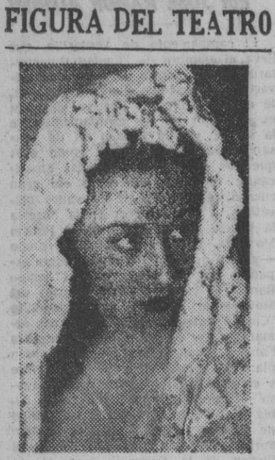
Maruja Tamayo, la bellísima primera figura de la Compañía de Gasa, que actúa con feliz acogida en el teatro Victoria