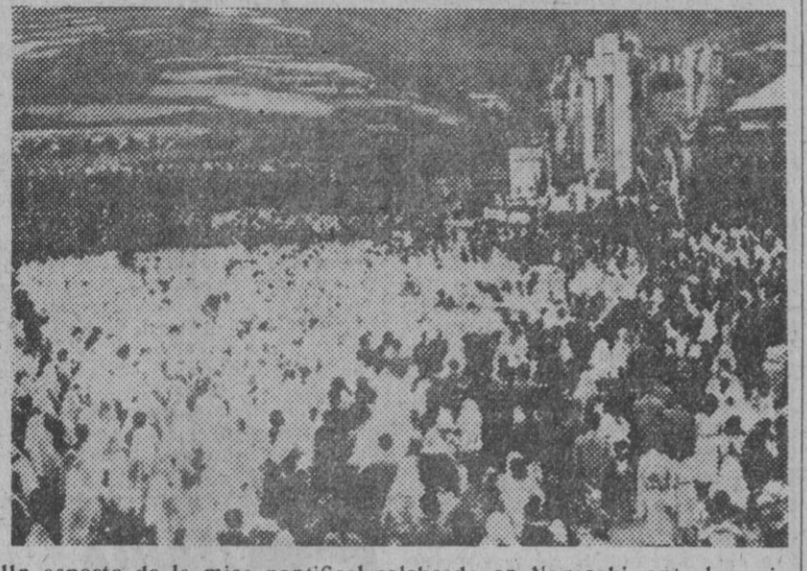
Un aspecto de la misa pontifical celebrada en Nagasaki, ante las ruinas de la que fue la mayor iglesia católica del Japón, destruida por la segunda bomba atómica. Al acto asistieron 30.000 fieles con motivo del IV centenario de San Francisco Javier.