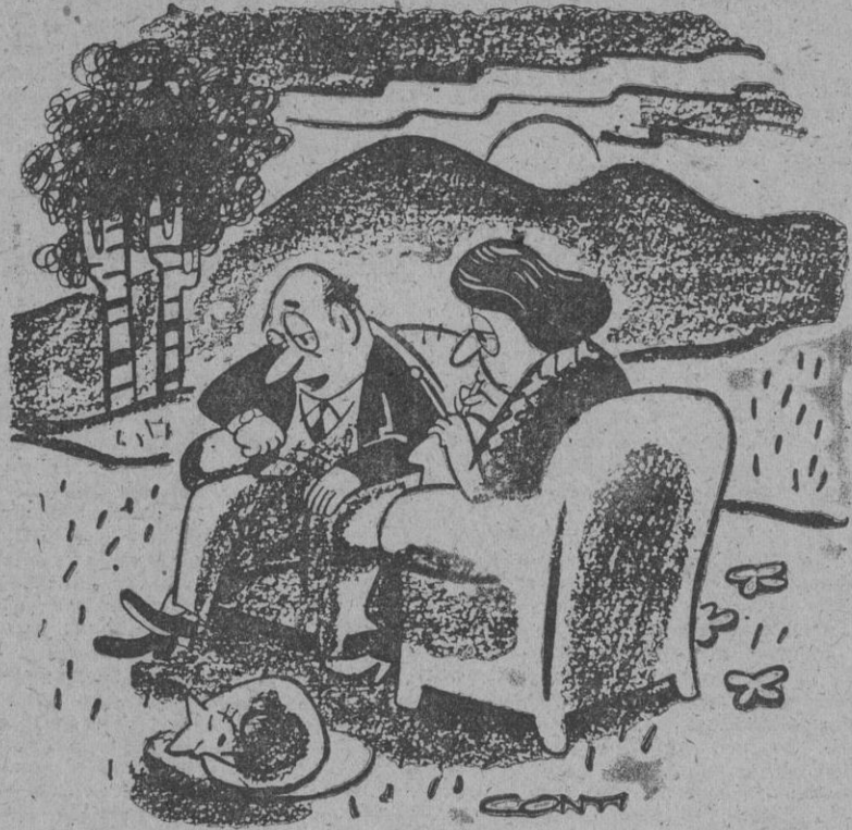
—¿No te parece que se retrasan en enviarnos la casa prefabricada?