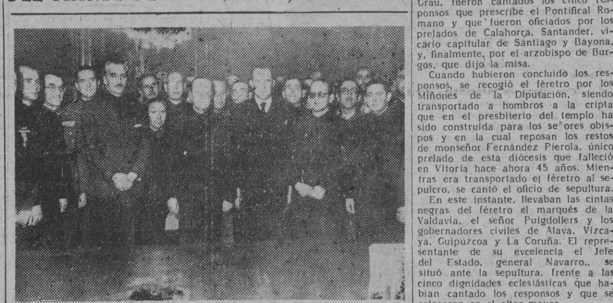
El ministro de Justicia y secretario general del Movimiento, señor Fernández Cuesta, en un acto celebrado en la Secretaría general, hace entrega de los premios "Luis M.º Soñredo" a los maestros del Frente de Juventudes.