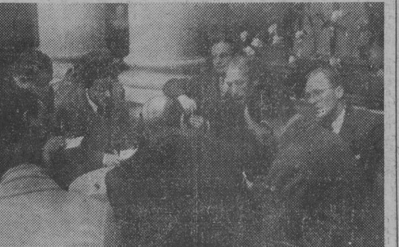
El encargado de Negocios de los Estados Unidos en España, señor Culbertson, con el agregado comercial señor Brandock y el cónsul en Barcelona señor Blake, durante su conversación con los periodistas barceloneses en el Hotel Ritz, en su estancia en nuestra ciudad.