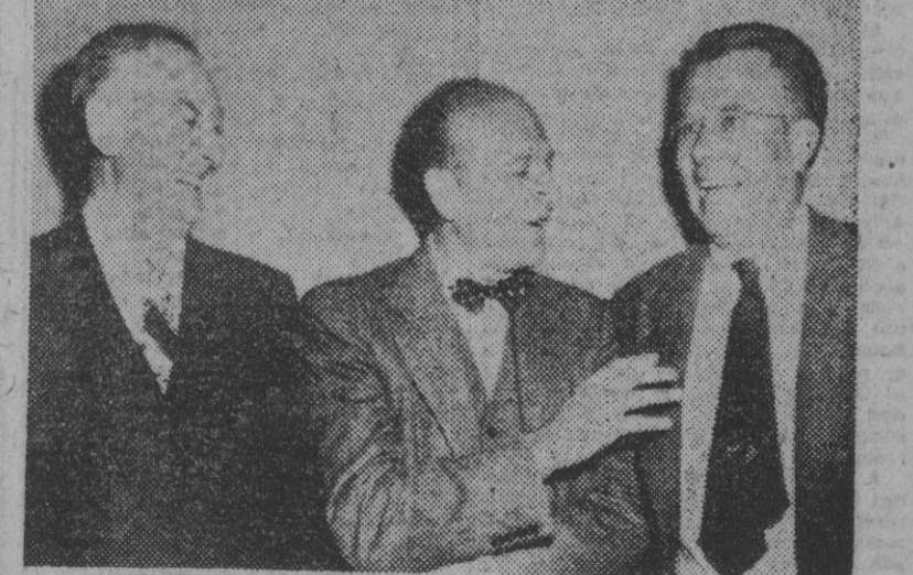
David Lilienthal, jefe de la Comisión americana de Energía Atómica (centro), con el presidente de la Universidad de California, y el Dr. Ernest O. Lawrence, ganador del Premio Nobel e inventor del ciclotrón, reunidos para el estudio de un nuevo ciclotrón veinte veces más poderoso que todos los hasta ahora existentes y que se tardará cinco años en construir, siendo su coste de 9.000.000 de dólares.