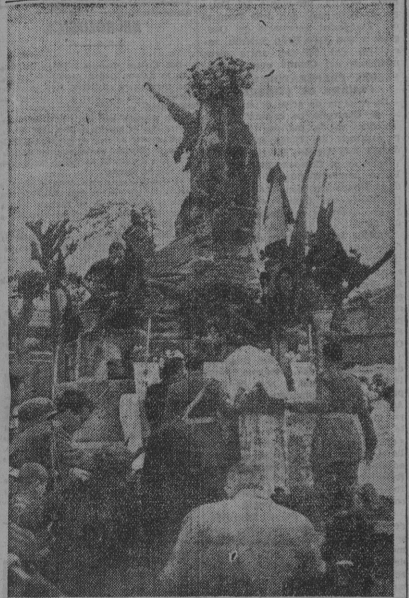
El Frente de Juventudes conmemora la fecha del Dos de Mayo con una misa y la ofrenda de una corona de laurel ante la estatua del alcalde de Móstoles.

El Frente de Juventudes al alcalde de Móstoles