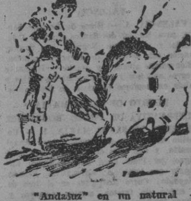
«Andaluz» en un natural