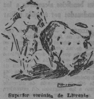
Superior verónica de Llorente

Los toros, muy bien presentados, con mucha leña, tardeaban en su corta y nada franca embestida. Salíanse sueltos de los caballos y llegaban aplomados al último tercio, no posibilitando el toreo de lucimiento que, en muy contadas ocasiones, por