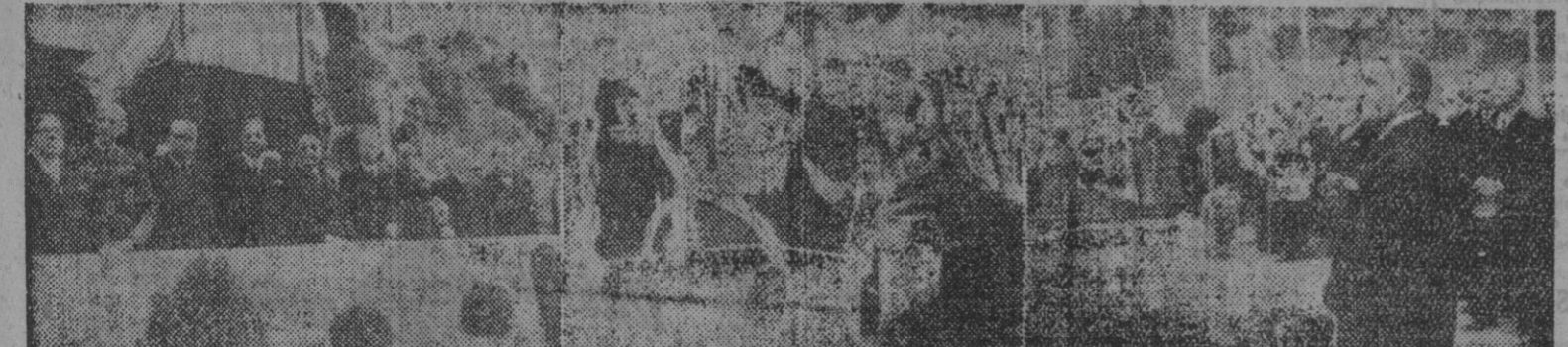
Con asistencia de las autoridades barcelonesas, tuvo efecto ayer la ceremonia de colocación de la primera piedra de la nueva Sucursal del Banco de España en la plaza de Cataluña. — II. Después del primer lanzamiento de cemento para la colocación de la piedra. — III. El señor Gedecebas du raitte su discurso.