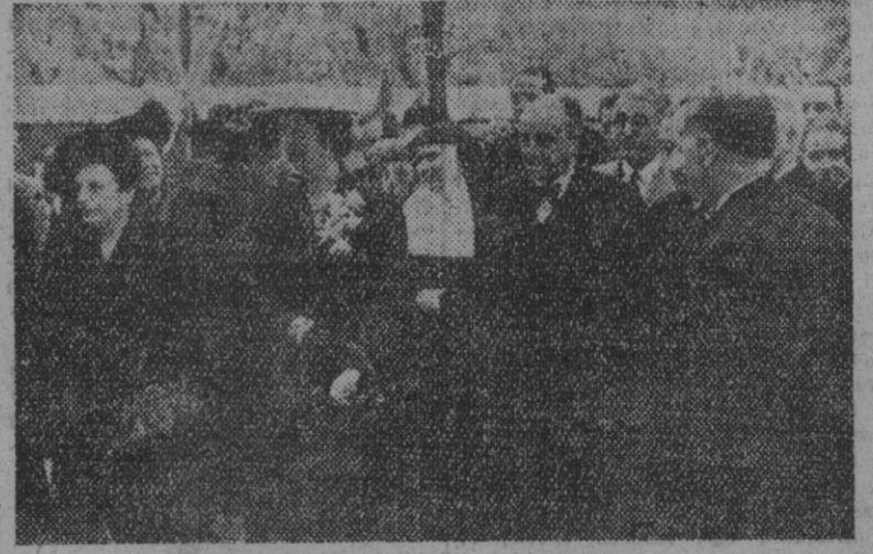
La esposa de S. E. el Jefe del Estado, acompañada del presidente de las Cortes y otras ilustres personalidades durante su visita al Hospital de San Juan de Dios, donde asistió a la solemne bendición del altar de Nuestra Señora de Belén.

La esposa del Caudillo en el Hospital de San Juan de Dios