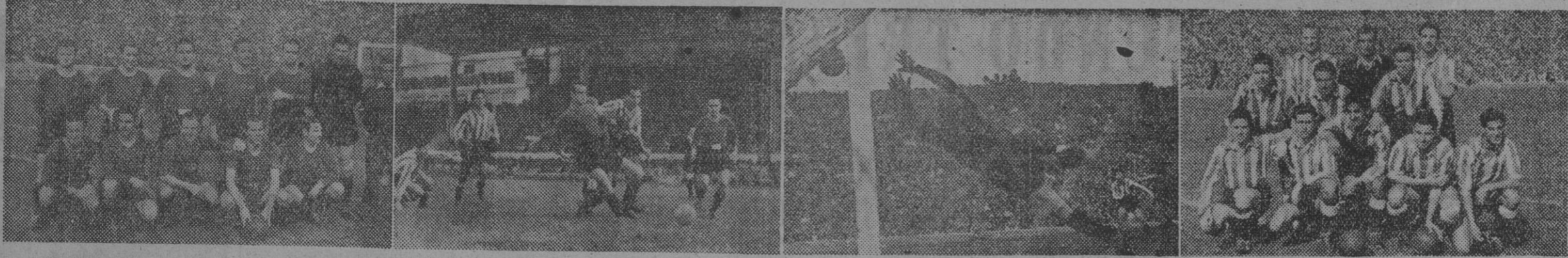
Del encuentro jugado ayer en Madrid, las fotos nos muestran en primer lugar al equipo del Barcelona. — Un momento de peligro ante la puerta azulgrana. Una intervención de Velasco y el equipo del Atlético de Madrid, que venció al representante catalán.