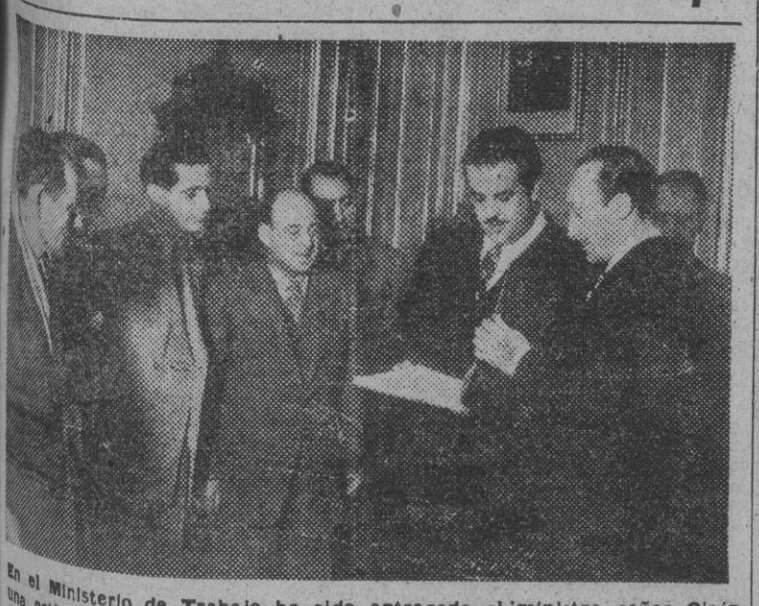
En el Ministerio de Trabajo ha sido entregada al ministro señor Girón una artística placa de plata con la que los obreros siderometalúrgicos de las provincias de Córdoba, Ciudad Real, Badajoz y Jaén, le expresan su gratitud por la creación de la Mutualidad correspondiente.

Entrega de una artística placa de plata al ministro de Trabajo