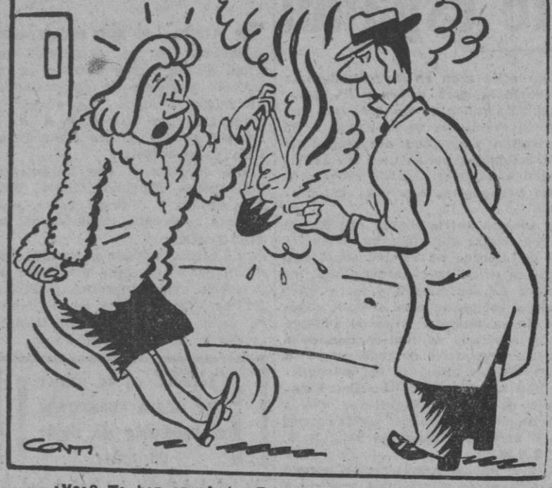
— ¿Ver? Te han engañado. Esto no es material plástico auténtico.