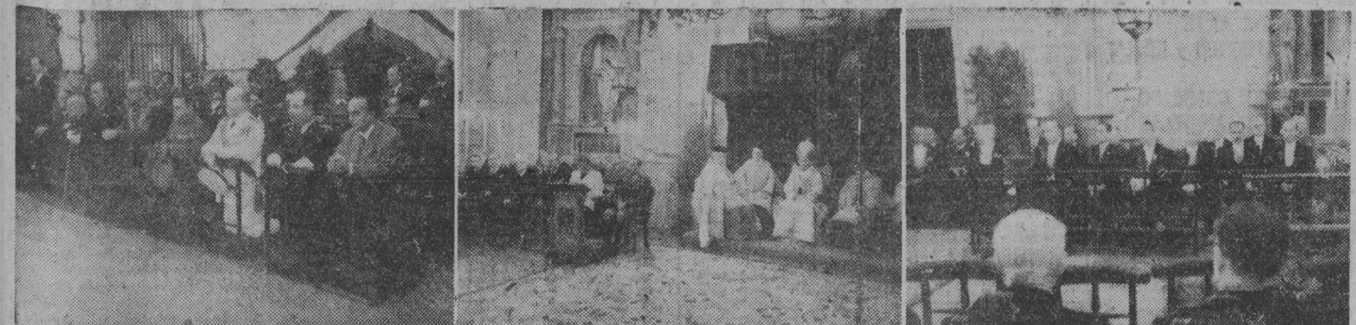
I. La presidencia de la función religiosa celebrada en la Prisión celular en honor de la Patrona de los reclusos. — II y III. El señor obispo las autoridades y el Ayuntamiento en pleno, que han asistido al solemne oficio que ha tenido efecto en la Basílica de la Patrona de la Diócesis barcelonesa. — (Fotos Pérez de Rozas)