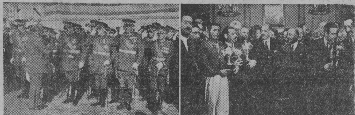
I. A su llegada al puerto de La Coruña, para presenciar las regatas de traineras y balandros, S. E. el Jefe del Estado es saludado por las autoridades que acudieron a complimentarle. — II. Después de celebradas las regatas, el Caudillo entregó personalmente los trofeos a los vencedores, en el Club Náutico. — (Foto Cifra)