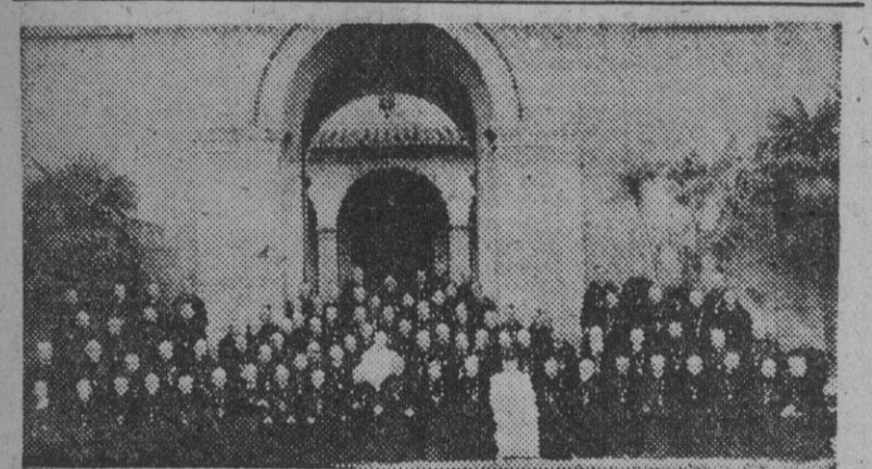
El Capítulo de Abades de la Orden Benedictina ha elegido en Roma a su nuevo Abad Primado, doctor Ka-lin, de nacionalidad suiza, que aparece en la foto en lugar preferente. Asistieron a este Capítulo cuatro Abades españoles: los de Montserrat, Silos y Samos y el de Nueva Nursia (Australia).