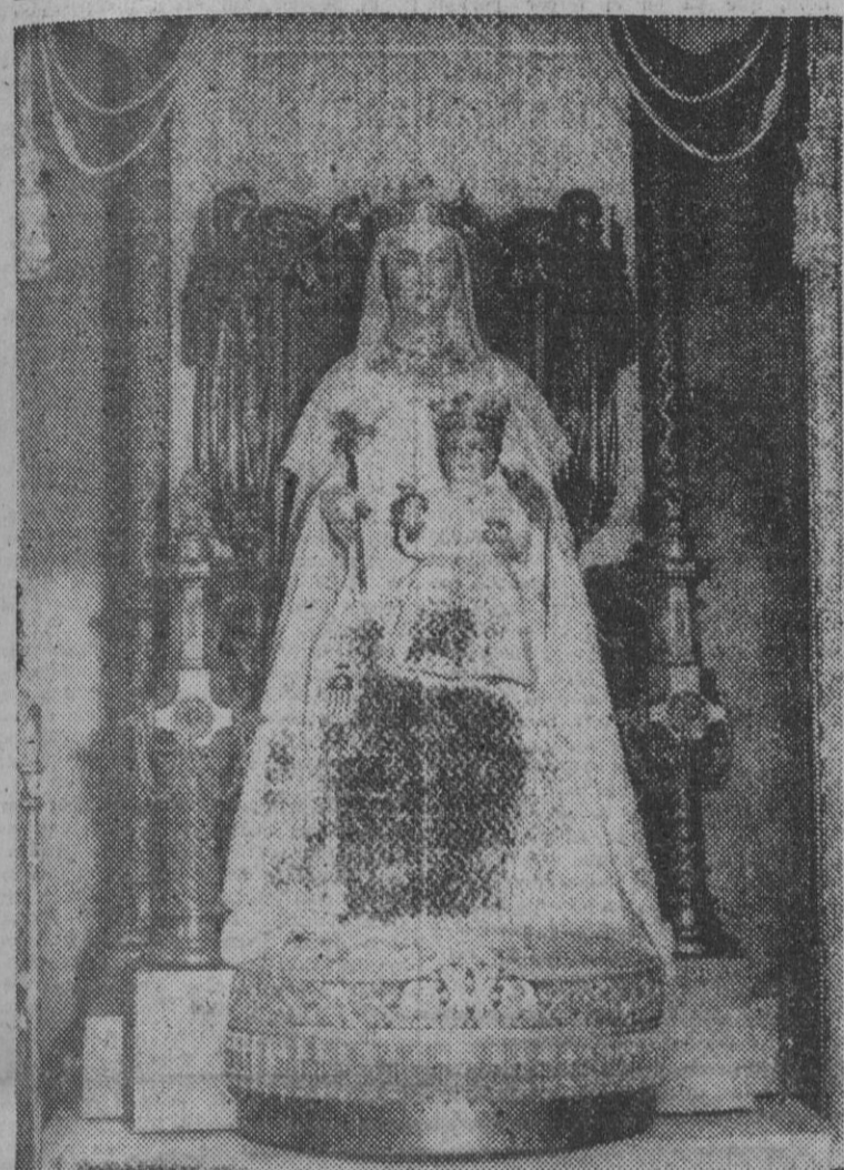
La actual imagen de la Patrona principal de la Diócesis de Barcelona, que se venera en su Basílica. Milagrosamente descendió a nuestra ciudad apareciéndose a Raimundo de Peñafort, Pedro Nolasco y Jaime I el Conquistador, predores, por orden de la Virgen, de la Orden Mercedaria que con tanto altruismo y celo ha trabajado para la redención de cautivos y para la conservación y aumento de la fe en nuestros días. En estos tiempos de profunda perturbación, los barceloneses ponemos toda nuestra confianza en la milagrosa patrona, seguros de que nos indicará el camino a seguir para nuestra salvación individual y colectiva.