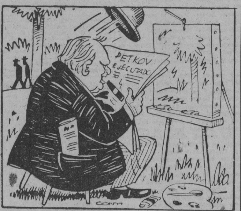
— ¡Caramba! Si en Inglaterra se ponen de moda estos sistemas, estoy histó!