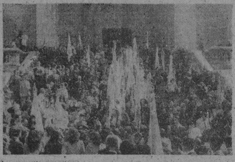
Los peregrinos mejicanos, con las Asociaciones religiosas españolas que los acompañan, al salir de la función religiosa celebrada en la iglesia de los Jerónimos, de Madrid.