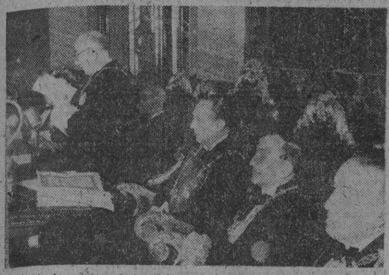
En el acto de apertura de los Tribunales, celebrado en el Palacio de Justicia, ha pronunciado un importante discurso el presidente del Tribunal Supremo. Ha presidido el acto el ministro de Justicia.