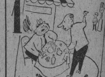
EN LA REVUELTA A LUIS