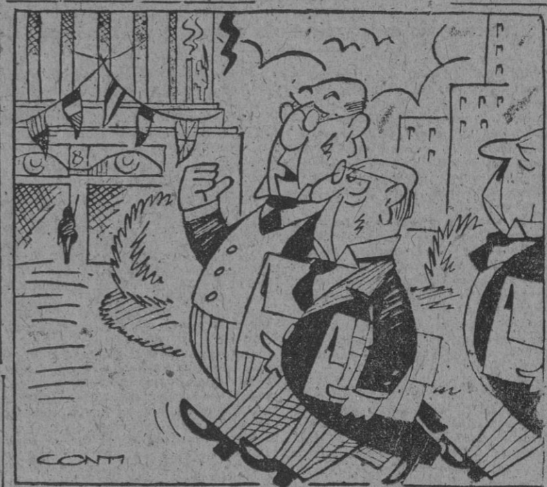
— Soy optimista. Creo que llegaremos a un acuerdo en todos los problemas. — En los problemas sí, pero en las soluciones lo voy más difícil.

Batalla campal en La Habana entre las fuerzas de policía