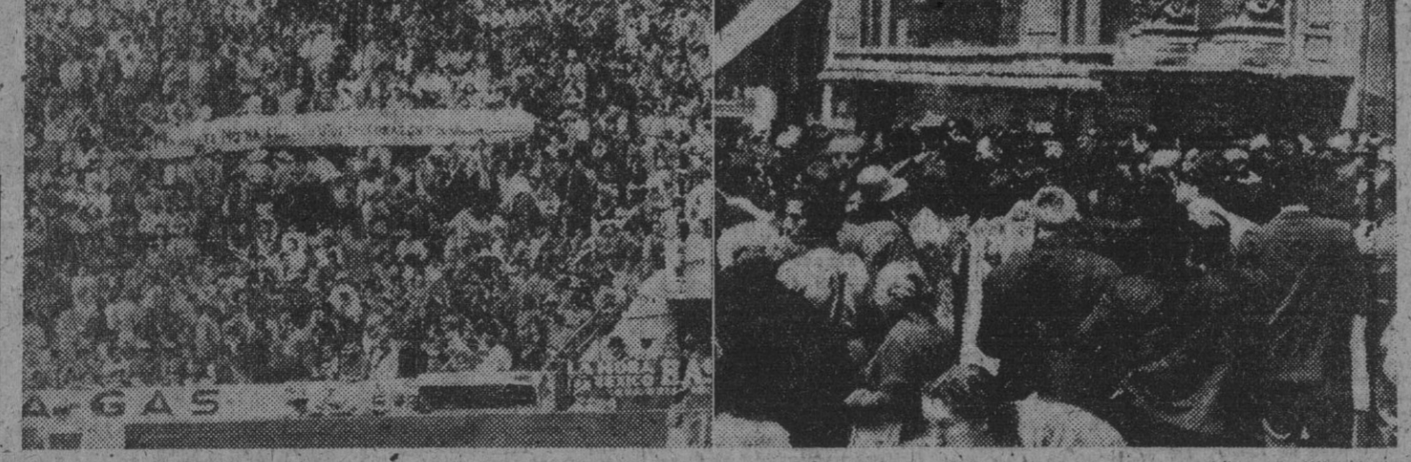
I. La muerte del torero español causó tremenda sensación en Méjico. En la corrida goyesca celebrada hace poco, las cuadrillas destilaron sin música, se guardó un minuto de silencio y por el amplio recinto de la plaza se veían enormes carteles alusivos al dolor de los mejicanos por la muerte del ídolo, tales como el que aparece en la foto, que dice: «Manolete no ha muerto; vive en el corazón de la nación mejicana». — II. Aspecto que ofrecía la entrada al templo donde se celebraron los funerales por el alma del diestro «Manolete».