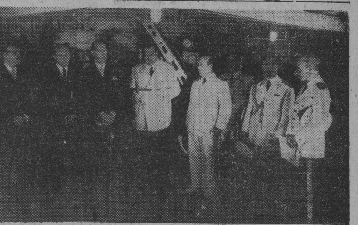
Un momento de la solemne ceremonia de la entrega de los restos de los padres del general San Martín realizada en San Sebastián por el ministro de Asuntos Exteriores del Gobierno español, a bordo del crucero "Argentina".