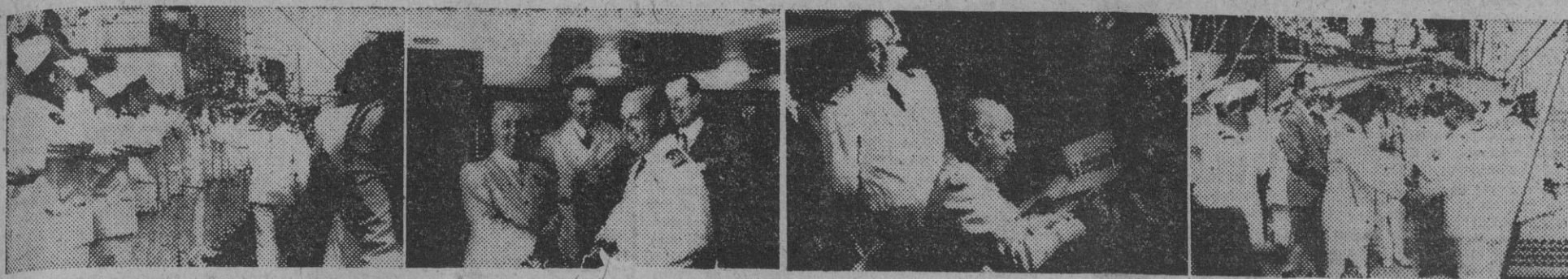
S. E. el Jefe del Estado, durante su estancia en San Sebastián, hizo una visita al crucero "Argentina", acompañado del ministro de Asuntos Exteriores, señor Martín Artajo. La información gráfica nos muestra la llegada del Generalísimo a bordo, otros momentos de la visita y el momento de la despedida.

El presidente argentino se trasladará a esta capital durante las últimas sesiones de la Conferencia Interamericana