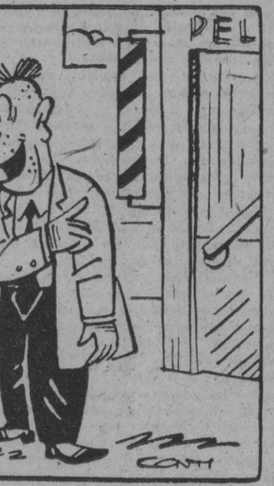
—Como barbero es pésimo, pero yo vengo cada día. Sabe los mejores chistes «tan-tan» de la ciudad.