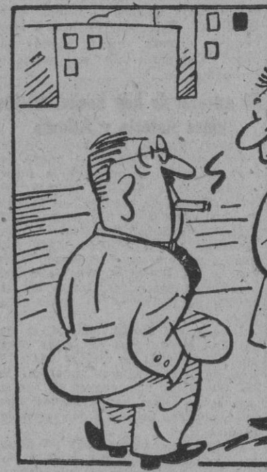
—Como barbero es pésimo, pero yo vengo cada día. Sabe los mejores chistes «tan-tan» de la ciudad.