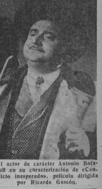
El actor de carácter Antonio Bofill en su caracterización de «Conflicto inesperado»...