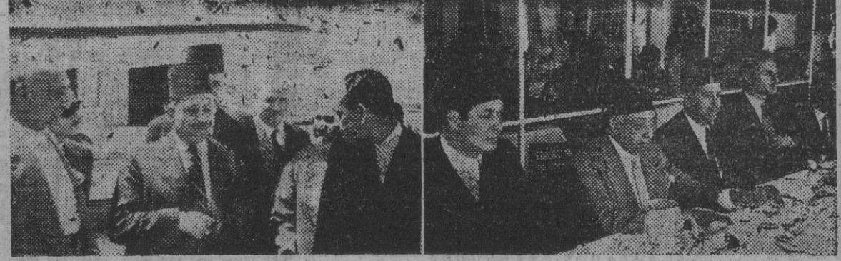
I. Mahmud Famy el Nokrasky, presidente del Consejo egipcio, con Abellh Megyd Saleh, ministro de Obras Públicas, llegan a Madrid de paso para los Estados Unidos, a donde se dirigen para tratar del problema de Palestina. — II. Los ilustres viajeros comiendo en el aeropuerto de Barajas antes de reemprender el vuelo.