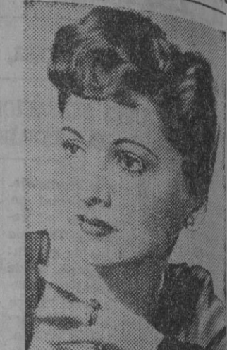
La bellísima «estrella» Joan Fontaine, que encarna el papel protagonista en la nueva película «Tyrone» donde aparece junto a Richard Dix y Herbert Marshall y Patric Knowles