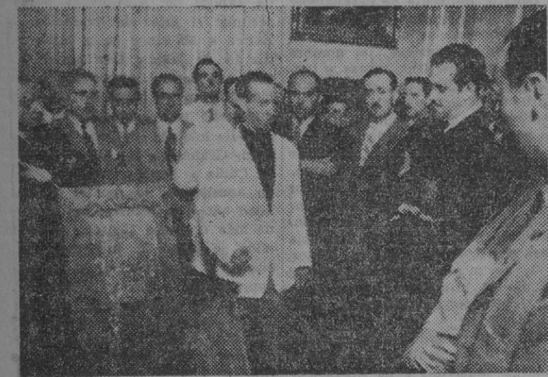
El delgado nacional de Sindicatos hace entrega al ministro de Trabajo de una placa de plata que simboliza el agradecimiento de todos los trabajadores de España por la labor realizada por don José Antonio Girón