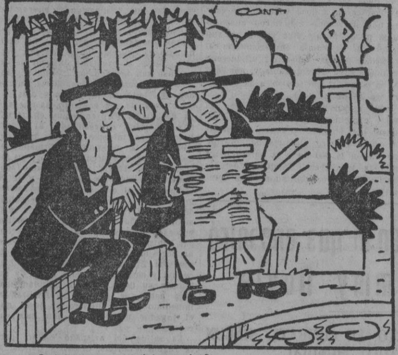
¿Qué le parece eso del complot? ¿Cuál? Porque, verá usted, cada día hay uno...

ESTA VIOLACION COINCIDE CON CIERTOS TRIUNFOS MILITARES DE LOS NACIONALISTAS HANGHAI, 17. Tropas procedentes de la Mongolia Exterior han invadido de nuevo el territorio de China, cruzando la frontera por la provincia de Sui yuan, según informa el periódico de Peiping "Hain Nin".