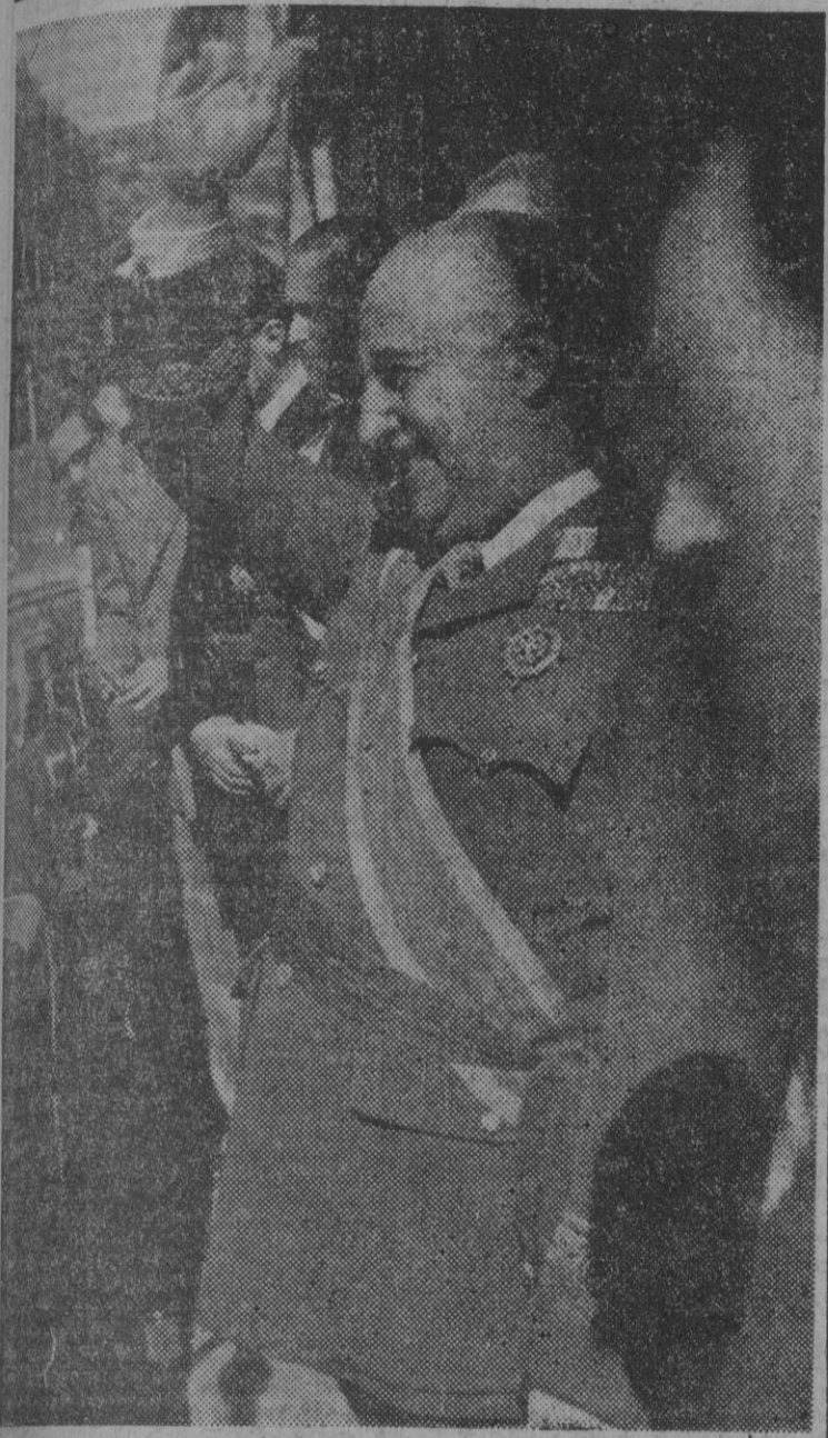
Franco, Caudillo de España, vigía permanente de nuestra paz y defensor de nuestra dignidad e independencia nacionales. En este 18 de Julio una vez más el pueblo español os renueva su gratitud y admiración por sus virtudes personales y el ejemplo de una vida consagrada enteramente al servicio de la Patria.