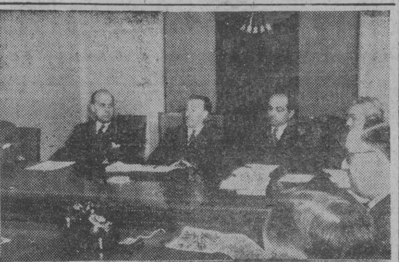
El delegado nacional de Sindicatos preside la primera reunión de la Comisión Ejecutiva Permanente del Congreso Nacional de Trabajadores, que estudia, entre otros acuerdos, la cuestión de los trabajadores represaliados.