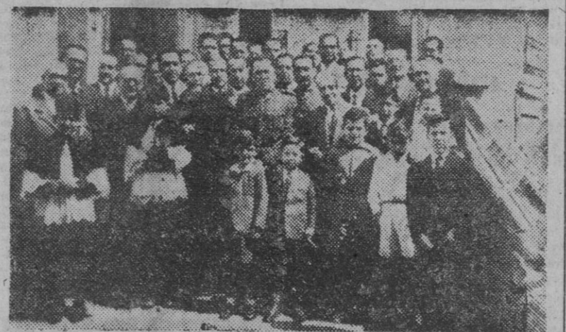
En Córdoba, los supervivientes de la gloriosa gesta del Santuario de Santa María de la Cabeza han celebrado el aniversario del asedio con una solemne fiesta religiosa. Los asistentes a la salida del acto.

Se pierden dos pesqueros españoles en las costas de Irlanda