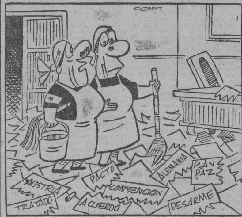
— ¡Hay qué ver lo mal que han dejado esto, camarada!