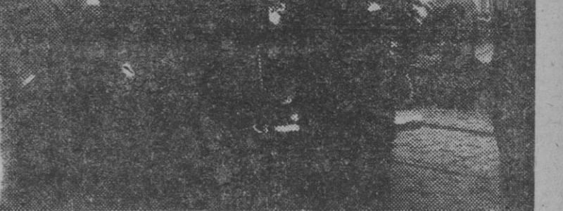
El director de Estudios Políticos, con el nuevo embajador de España en Buenos Aires, en el muelle de Cádiz, momentos antes de embarcar en el «Marqués de Comillas» rumbo a América.

El ministro de Asuntos Exteriores llegará mañana a Barcelona