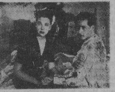
Una escena del film "Niebla en las Almas", que hoy se estrena en Alcazar.