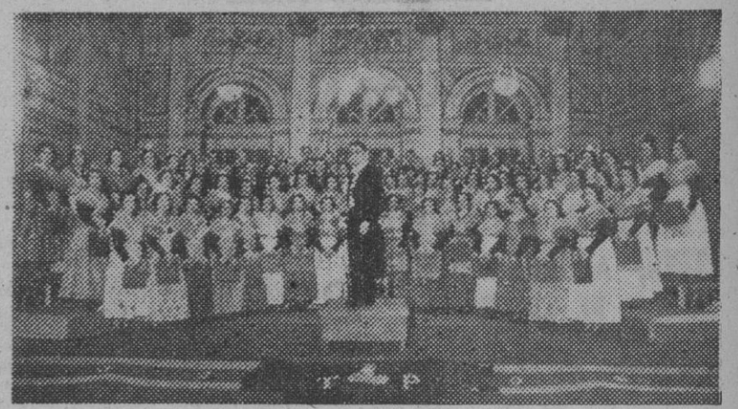
La Coral Polifónica Valencina