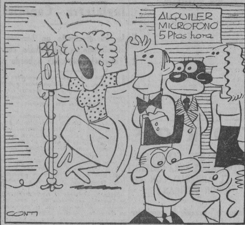
—¿Cómo va eso? —El programa muy mal pero el negocio muy bien.