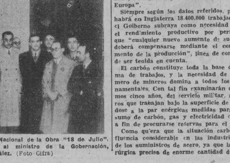
Terminadas las tareas del Consejo Nacional de la Obra "18 de Julio", una Comisión de la misma visitó al ministro de la Gobernación, don Blas Pérez González.