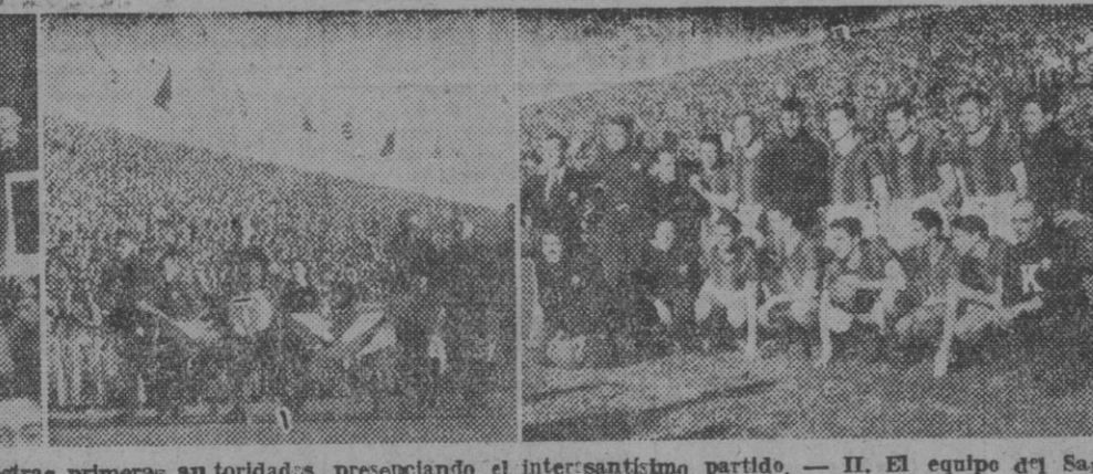
I. La tribuna presidencial ocupada por nuestras primeras autoridades, presenciando el interesantísimo partido. — II. El equipo del San Lorenzo de Almagro de la vuelta al campo con la bandera argentina desplegada. — III. El San Lorenzo de Almagro estaba integrado por Blazina; Crespi; Easso; Zubieta; Greco; Colombo; Imbelloni; Farrow; Martino; Fontana y Silva. — IV. Por el Combinado español jugaron: Bañón; Alvaro, Curta; Gonzalvo III, Fábregas; Gonzalvo II; Epi; Arz, Lángara, Herreria y Escuder.