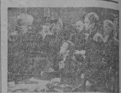
Una escena del film «Corsarios de Florida», que hoy se proyecta en el Cristina