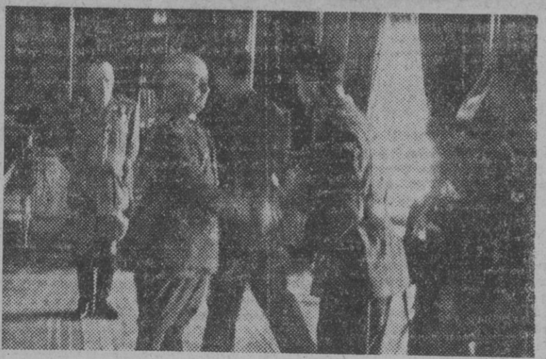
S. E. el Generalísimo, saludando a uno de los soldados que, con los ministros jefes, oficiales y clases, asistieron al acto de la imposición de la primera Gran Cruz del Mérito Aéreo.