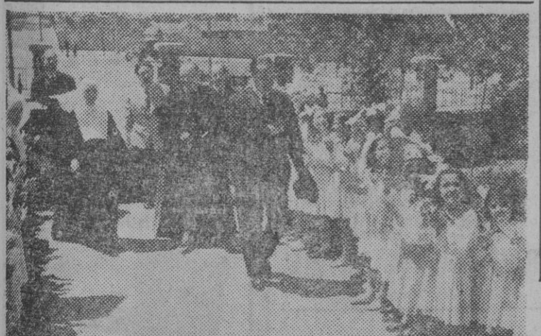
El ministro de la Gobernación, acompañado del obispo de Madrid, Alcalá, y otras personalidades, visita el albergue infantil de María Cristina, antes de imponer la Cruz de Beneficencia a la madre superiora del dicho centro benéfico, que le fué concedida por sus valiosos servicios.