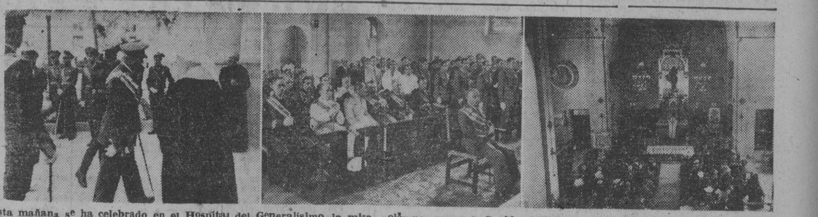
Esta mañana se ha celebrado en el Hospital del Generalísimo, la misa solemne con que la Sanidad Militar ha honrado a su Patrona, Nuestra Señora del Perpetuo Socorro. En la primera foto, llegada del capitán general de la Región, don José Solchaga, al Hospital. — II. Un aspecto de la capilla durante la misa. — III. El altar mayor.

Tito añadió que deploraría la falta de comprensión aliada en el caso yugoslavo. Por último, el mariscal Tito, dijo: "El primer ministro italiano, De Gasperi, demostró 'falta absoluta de responsabilidad' cuando manifestó el día 23 de junio que Italia resistiría con toda su fuerza y por todos los medios disponibles, la internacionalización de cualquier parte de la región disputada entre ambos países."