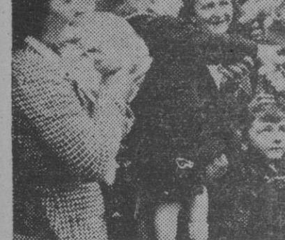
Para conmemorar el aniversario de su llegada a Francia en 1944, el general De Gaulle pronunció un importante discurso, en el que habló del problema constitucional. En la foto, el general francés saluda a los niños de Bayeux, mirados por sus madres al ilustrar soldado

Queda en el "orden del día" del Consejo de Seguridad, pero se rechazó la propuesta soviética de volver a considerar la cuestión para el primero de septiembre