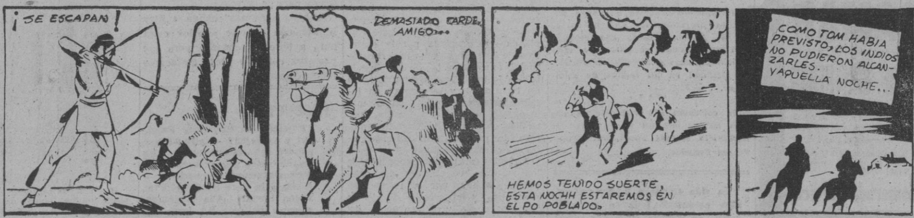
¡SE ESCAPAN! DEMASIADO TARDE AMIGOS... COMO TOM HABIA PREVISTO, LOS INDIOS NO PUDIERON ALCANZARLES. YAPUELLA NOCHE... HEMOS TENIDO SUERTE, ESTA NOCHE ESTAREMOS EN EL PO POBLADO.