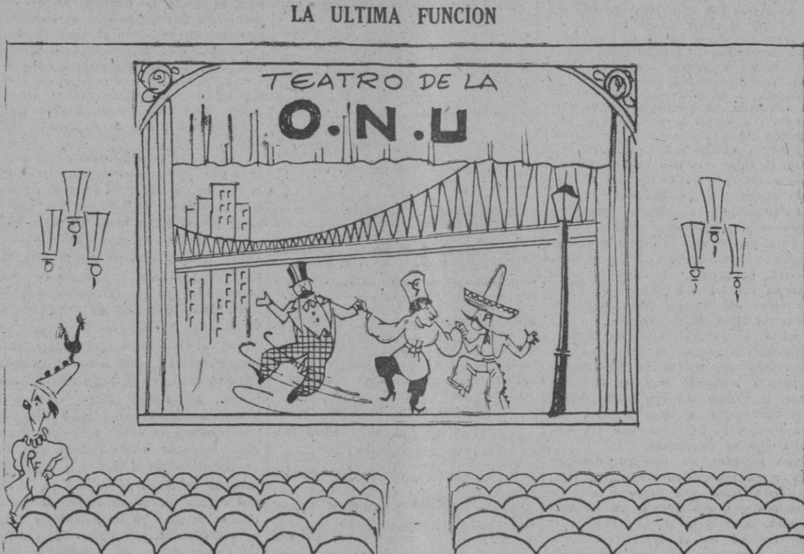
GROMYKO: — Me da la sensación de que estamos haciendo el ridículo.

TEMPERATURA IDEAL COCINA SELECTA CONJUNTO TORRENS MAYMIR. Con el violinista francés BEAUVAIS. ORQUESTA BRUJOS DEL CASTILLO