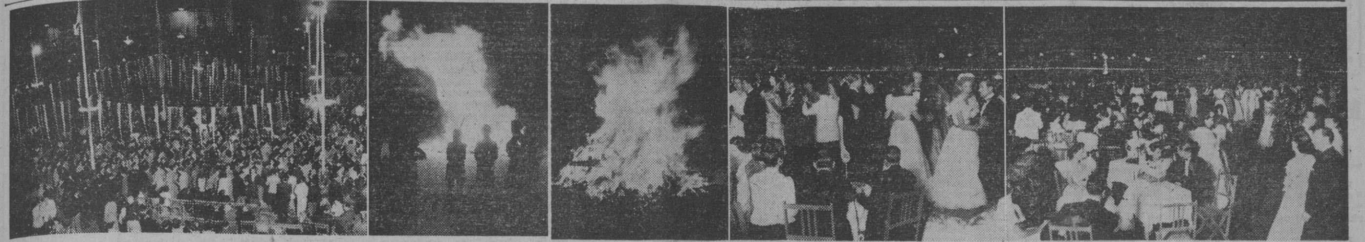
Barcelona, en la noche de San Juan, vibra intensamente en un expansionamiento casi de locura, de noche única, inexpresable. Las demás verbenas, son eso: verbenas. Pero la de San Juan es un vértigo, es como un exteriorizar de deseos insatisfechos de divertirse al aire libre, después del invierno. Hé aquí las clásicas hogueras, y la elegante verbena del Real Tenis Club Barcelona y la más popular del Pueblo Español.