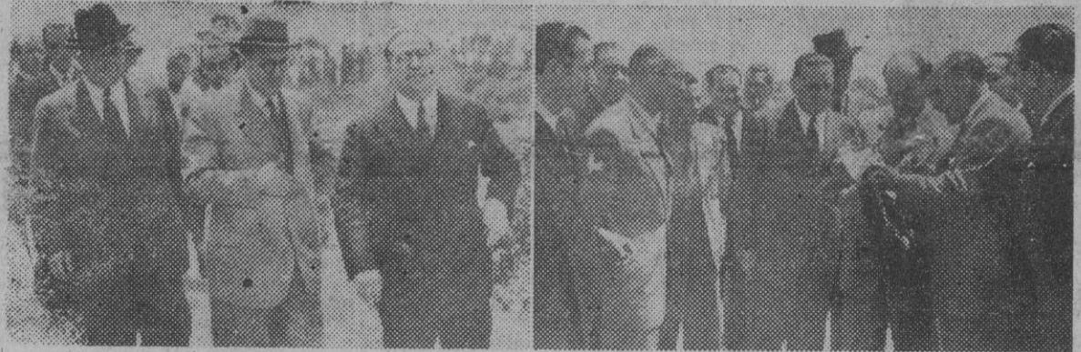
El señor Ibáñez Martín, acompañado del gobernador civil y del rector de la Universidad, ha verificado una visita a los terrenos de la futura Residencia de Estudiantes, escuchando las explicaciones de los arquitectos sobre el mismo terreno.

El ministro de Educación Nacional, en Barcelona