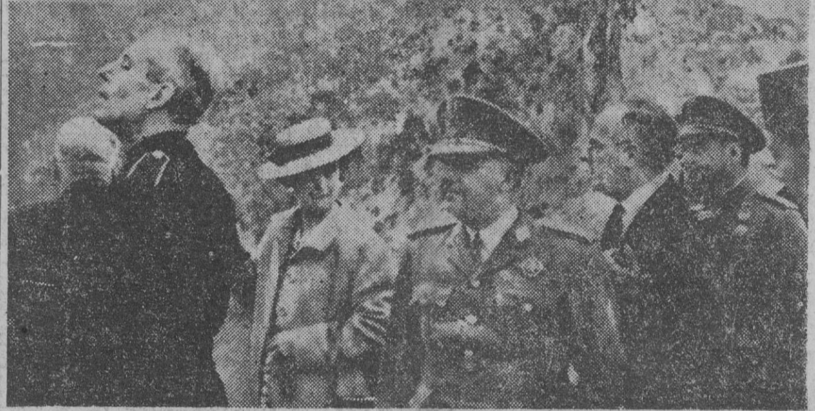
S. E. el jefe del Estado, con su esposa y séquito, recorre las instalaciones del nuevo pantano del Tranco, Jaén, segunda obra hidráulica de España, después del Esla.