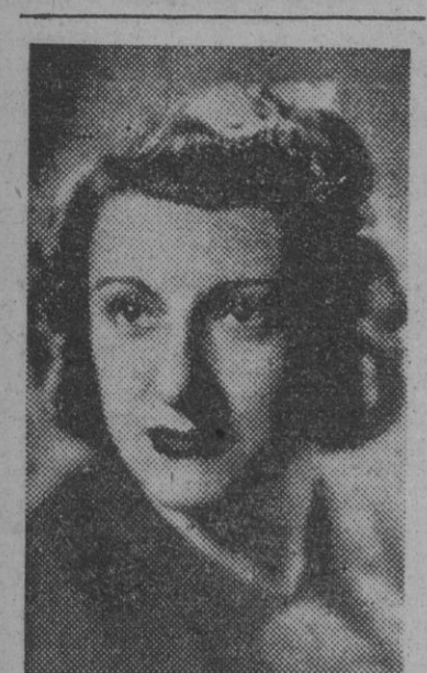
FIGURA DEL TEATRO