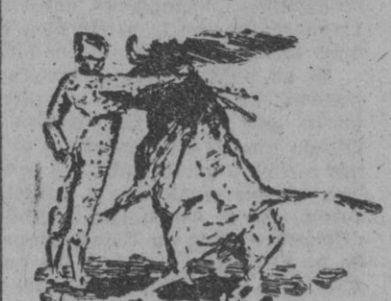
Ortega, en un pase por alto