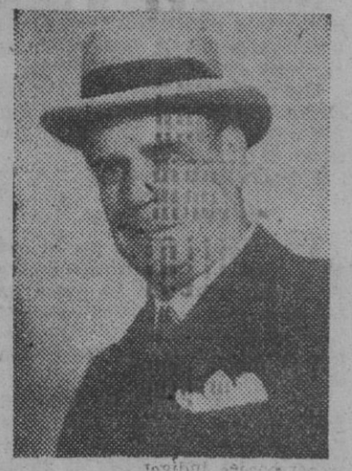
Jaime Borrás, el notable y aplaudido primer actor que actúa con éxito en el teatro Apolo