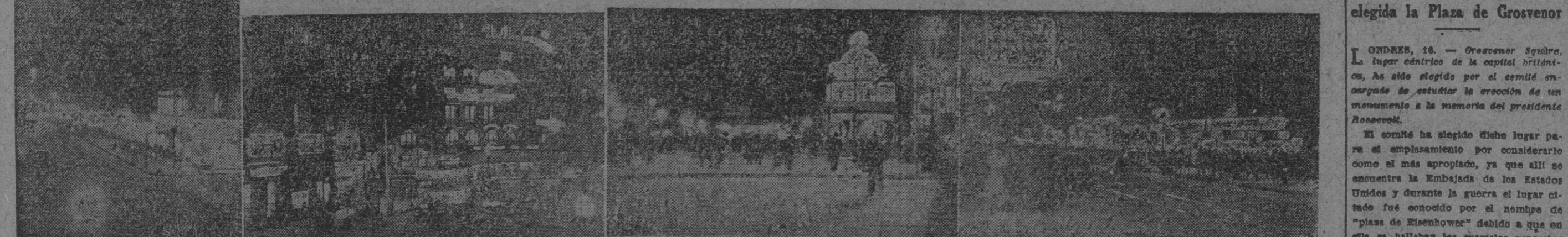
El oscurecimiento impuesto por las restricciones de energía eléctrica ha cesado en nuestra ciudad, cuyas calles ofrecen ahora, por la noche, es las bellas perspectivas. Los anuncios luminosos destacan su varia y cambiante polifonía, entre el alumbrado normal y todo ello, en conjunto, contribuye a dar testimonio de la actividad y bienestar característicos de España bajo el signo de su reconstrucción firme, segura e incansable por voluntad del Caudillo y con la ayuda de Dios.