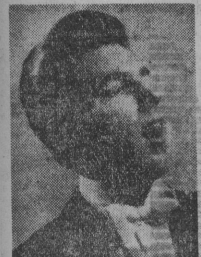
Andrés Ballester, galán cinematográfico y cantor que se presenta hoy en el teatro Cómico en su compañía...