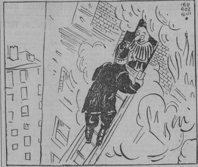
—¡Bah! Esto no es incendio ni nada, amigo bombero. ¿No ve usted que yo fui ministro republicano en España?