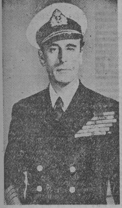
El almirante lord Luis Mountbatten, jefe supremo de las fuerzas aliadas en el sudeste asiático