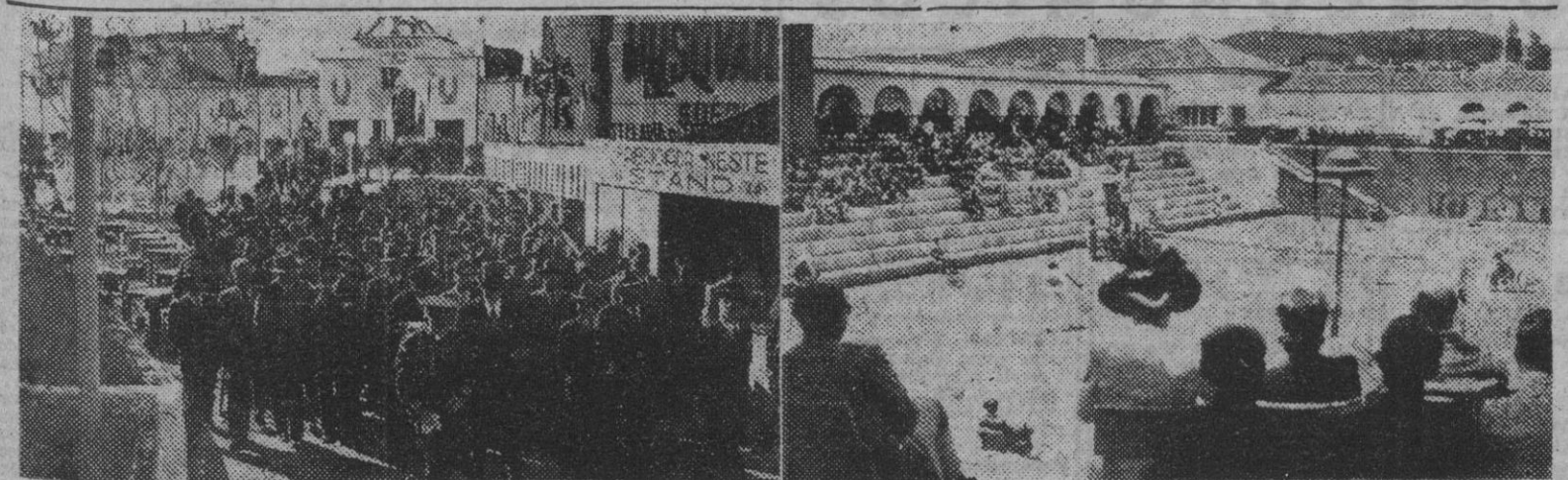
El jefe de la Casa Militar del jefe del Estado portugués, en representación del general Carmona, acompañado de miembros del Gobierno y embajadores de Estados Unidos e Inglaterra, en el acto inaugural de la Feria Popular de Lisboa. — II. Un aspecto del Estadio Nacional de Tenis, de la capital portuguesa, durante uno de los partidos recientemente celebrados.