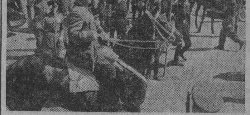
S. E. el Jefe del Estado, Generalísimo Franco, dirigiéndose a caballo a revisar las fuerzas que tomaron parte ayer en el desfile celebrado en Madrid, con motivo de conmemorarse el VI aniversario de la Victoria

Con mayor entusiasmo si cabe, que en años anteriores, celebró Madrid el sexto aniversario de la Victoria. La capital amaneció enlutada de colgaduras y banderas nacionales y del Movimiento y el fervor patriótico ha superado al de años anteriores. El pueblo entero acudió a este homenaje al Ejército victorioso en la