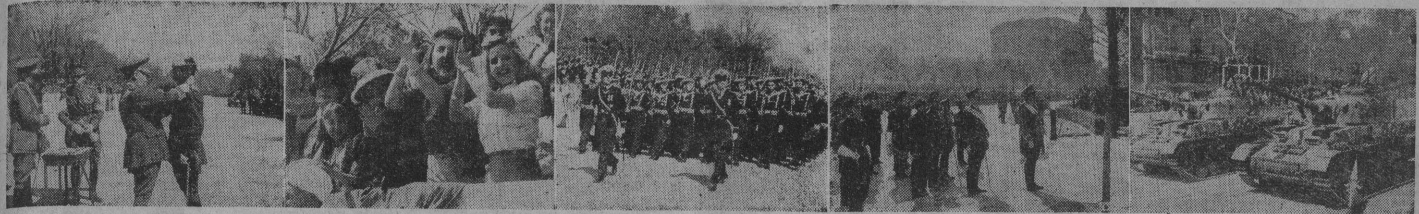
1. El Generalísimo imponiendo la Laureada al comandante de la Guardia Civil, don Enrique Serra. — 2. El público, en una de las tribunas, ovaciona entusiastamente al paso de las tropas. — 3. Fuerzas de la Marina, desfilando ante la tribuna de autoridades. — 4. El capitán general de Madrid, teniente general Muñoz Grandes, preside la misa de campaña celebrada en la Avenida del Generalísimo. — 5. Un momento del desfile de carros de combate.