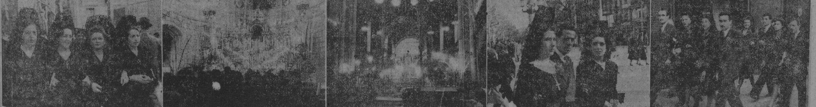
Con el tradicional fervor de todos los años, se está celebrando la Semana Santa en nuestra ciudad. Nuestra información gráfica del acontecimiento presenta a los de distinguidas señoras ataviadas con la española mantilla, y en el interior de los templos de la ciudad en los que, con todo esplendor, lucen los Monumentos.